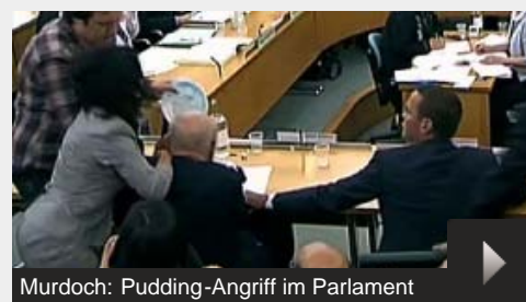
Murdoch: Pudding-Angriff im Parlament